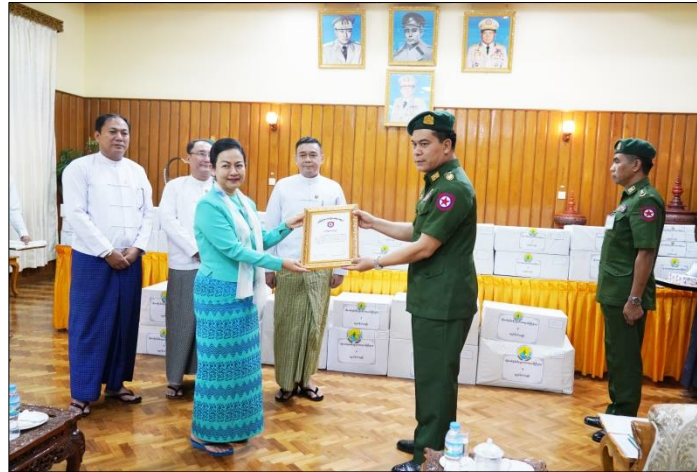
ဝန်ထမ်းမိသားစုများကို ဂုဏ်ပြုစားသောက်ဖွယ်ရာများပေးအပ်ခြင်း

ဟိုတယ်နှင့်ခရီးသွားလာရေးဝန်ကြီးဌာနမှ ဝန်ထမ်းမိသားစု များက နိုင်ငံတော်ကာကွယ်ရေးနှင့် လုံခြုံရေးတာဝန်များ ကို စွမ်းစွမ်းတမ်းတမ်းဆောင်ရွက်ရုံသာ လုံခြုံရေးတပ်ဖွဲ့ ဝင်များအတွက် ဂုဏ်ပြုစားသောက်ဖွယ်ရာများပေးအပ်